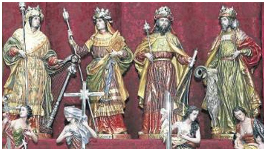
El paso de la Coronación lucirá ocho figuras de Romero Zafra

El paso de Nuestro Padre Jesús Humilde en la Coronación de Espinas, hermandad de la Merced, estrenará el próximo Lunes Santo ocho nuevas figuras realizadas por el reconocido imaginero cordobés Francisco Romero Zafra.