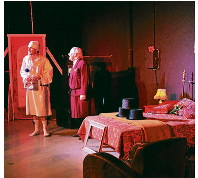
Imagen de una escena de “Tres sombreros de copa”.

Concierto fin de curso. Las Bandas y Orquestas del Conservatorio Profesional de Salamanca ofrecieron ayer en el CAEM sus conciertos fin de curso.