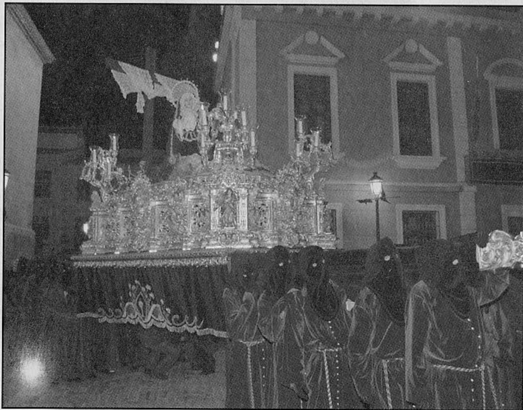
Espectacular trono del Cristo Yacente y Virgen del Dolor.