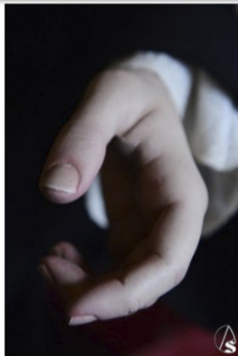
miércoles, 08 de marzo de 2017