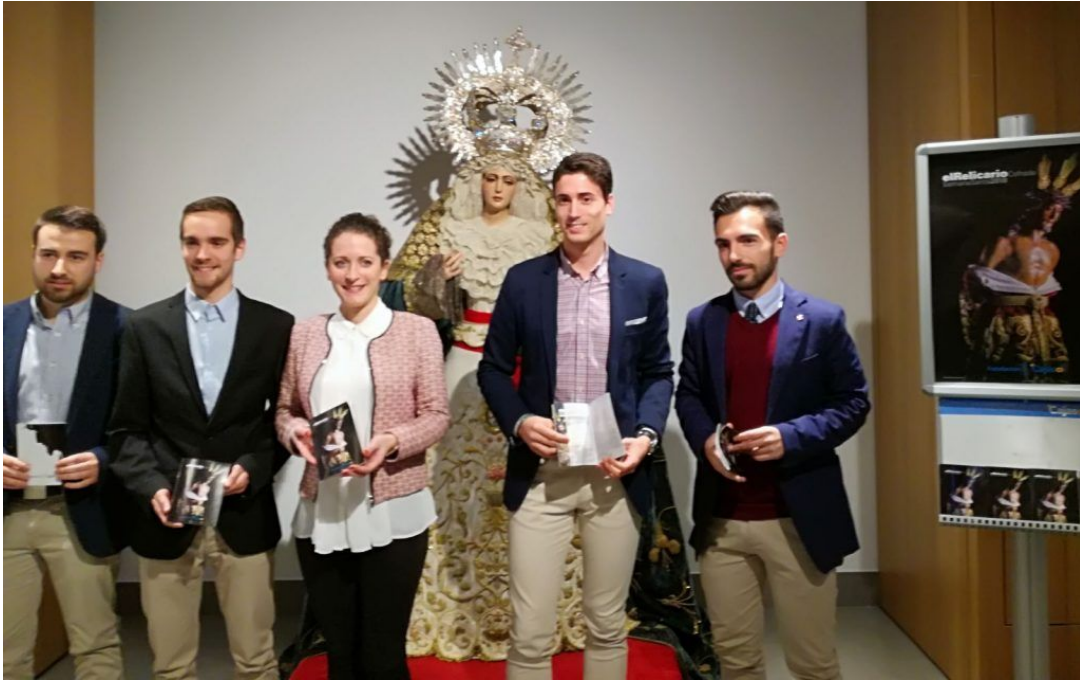
Acto de El Relicario Cofrade y la Fundación Cajasol, donde se halla una de las imágenes, de Carmen Bernal, que estará en la muestra.

La exposición "Imaginería Escultórica" permanecerá abierta al público hasta el sábado 31 de abril en la sede de la Fundación Cajasol (Ronda de los Tejares, 32), en horario de lunes a domingo, de 11.00 a 14.00 horas, y de 18.00 a 21.00 horas; cerrando únicamente los días 25 de marzo y 1 de abril.