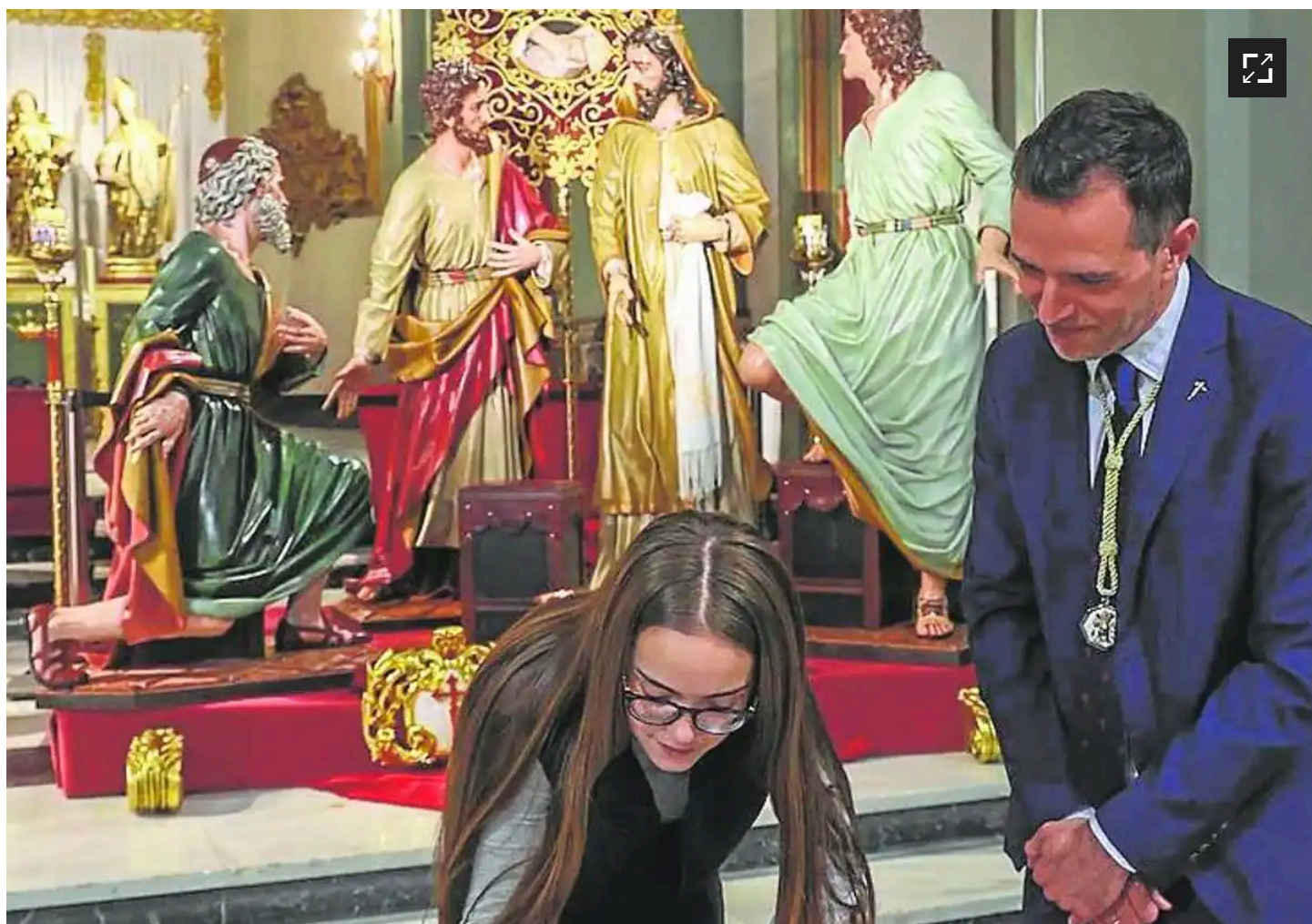
Acto fundacional del tercio y presentación de la obra anoche. P. S. / AGM

El Lavatorio de los pies, que saldrá sobre el actual trono reformado de la Elección de los Zebedeos, aporta «calidad artística» a la Agrupación y al desfile